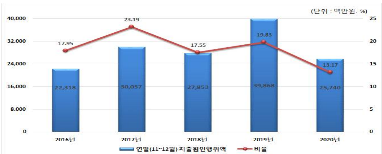
연말지출비율 연도별 변화